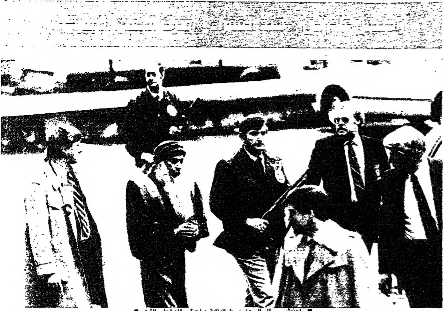
راجينش... ان السجن وسط البلفق: لحية - الهولاجا - الذي

الزعيم الروحي الهندي باجوان شري راجينش وصل الى نيويورك بعد الطوع الذي وضعه وجه لوجه مع القضاء الاميركي. ولدى وصوله الى العاصمة الهندية قتل راجينش وهو من كبار الداعين الى حرية الجنس. ان الولايات المتحدة بلد بغيض. في ما الهند بلد جميل... وهذا شعر بالراحة والغبطة. الاذن ان باجوان شري راجينش (٥٢ عاماً) والذي واكبته حاشية كبيرة وطبيب. اجتاز بلا عوائق. حواجز ادارات الهجرة والجمارك التي لم تفتح حافته وصنفاه وثقله. ولم يدل بآية ايضاح حول مشاريعه المستقبلية. كما انه رفض التعليق على احتمال توليه سلطات طائفته التي تعان ان عدد اعضائها يصل الى نحو ٥٠٠ الف عضو في العالم. ومن المتوقع ان يخوض معركة حامية مع مصلحة الضرائب الهندية التي تطالبه بتسديد مبالغ مستحقة. في حدود ١٧ مليون دولار. وفي عودة الى الورد، تشير ان الزعيم الروحي باجوان شري راجينش حكم عليه بالسجن (مع وقف التنفيذ) لمدة ١٠ سنوات لانتهائه القوانين الاميركية. وكان قد وصل الى الولايات المتحدة في العام ١٩٨١. واعطيت له مهلة لمدة خمسة ايام لتزكيا. حيث تعرض لعقوبة بالسجن لمدة ١٧٥ يوماً لقائه بقدر زيجات وهمية بين اعضاء اميركيين من طائفته واتباع اجانب لكي يستطيعوا البقاء في الاراضي الاميركية. المختر ان الزعيم الروحي ترك وراءه ٩٣ سيارة و١٥٠٠ رولز رويس يعزّم اتباعه يبعثا لكي يتمكنوا من الاستمرار في الحياة. في طائفة راجينشديورام في ولاية اوريفون. بقي ان تشير ان باجوان شري راجينش سوف يقصد منتجعات خاصة في الهند للاقبال من امراض في الكلى تؤرقه. ويتخصص الجيش على طريقة القراء والمهرجات الهندية. على الرغم من انه ترك لزوجته طائفة في الولايات المتحدة تقدر بملايين الدولارات. وهذا جزء من الروحانية التي يركز بها مع جماعة راجينشديورام.